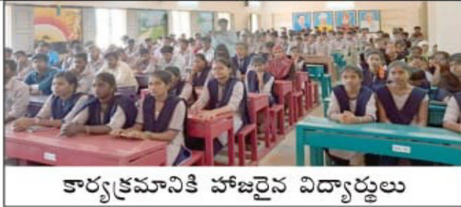
కార్యక్రమానికి హాజరైన విద్యార్థులు

వుతున్న చట్టాలపై అవగాహన కల్పించడం జరిగింది. ఈ కార్యక్రమంలో ముఖ్య అతిథిగా కళ్యాణదుర్గం న్యాయ సేవా సమితి చైర్మన్, జూనియర్